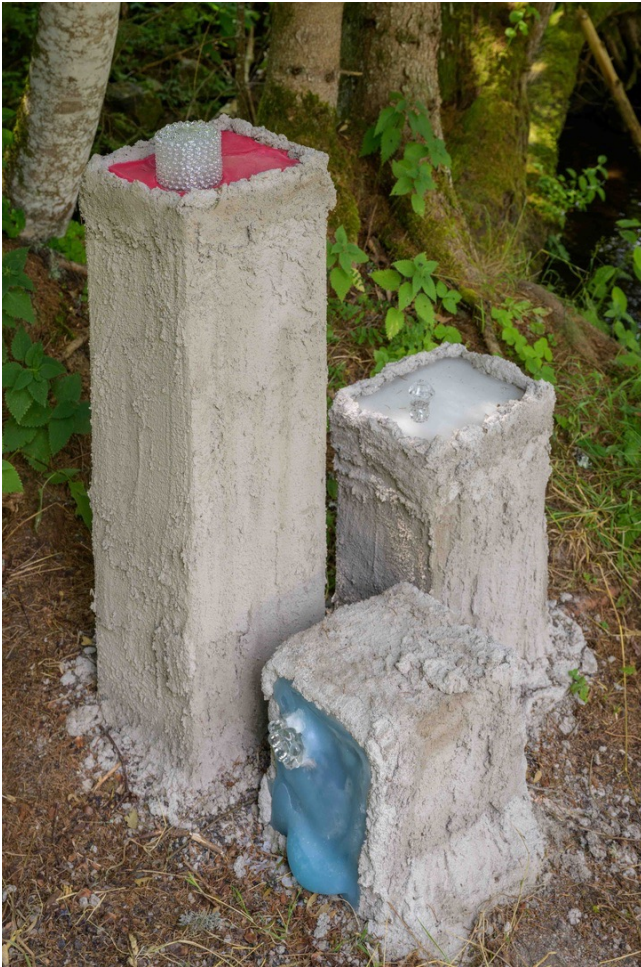
Bild: Marc Doradzillo Credits: Black Forest Institute of Art / 2023